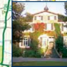
Herrenhaus Pröbting Herenhuis Pröbting