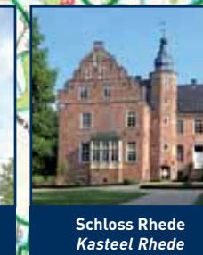
Schloss Rhede Kasteel Rhede