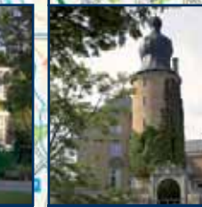
Wasserburg Gemen Waterburch Gemen