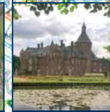
Wasserburg Anholt Waterburch Anholt