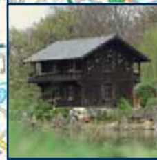
Anholter Schweiz Klein Switzerland