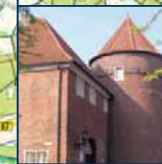
Museum Burg Ramsdorf Museum Burg Ramsdorf