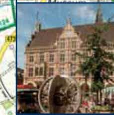
Bocholter Rathaus Raadhuis Bocholt