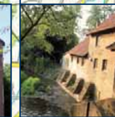
Alte Wassermühle Oude watermolen